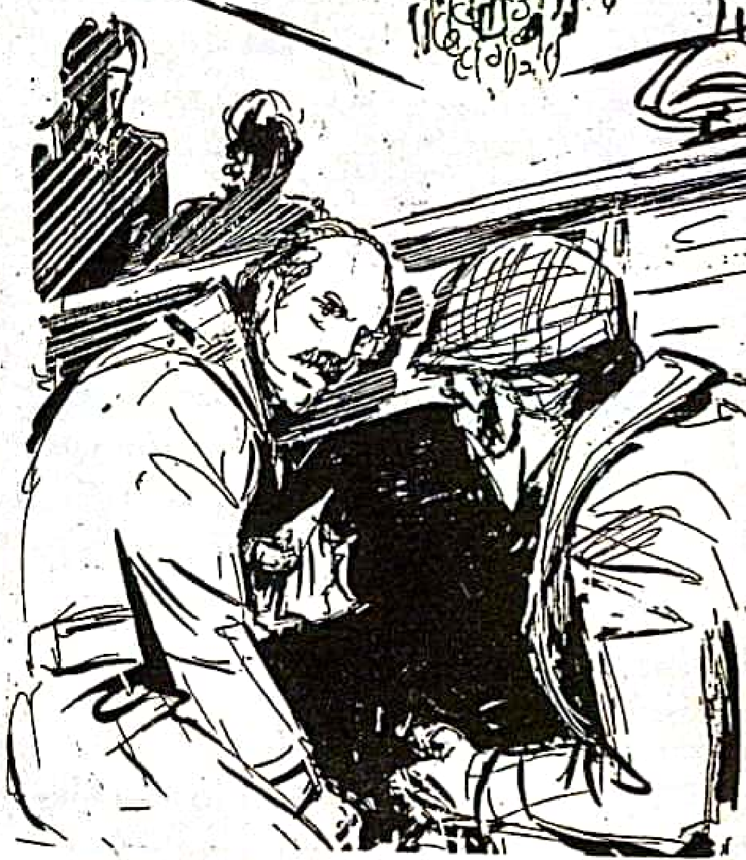
كان ( يوارو ) قد وجد ورقة ممزقة ملقاة في إهمال هناك .. نظر لها ثم تاملها لدهشة .. وهو ينظر له ..